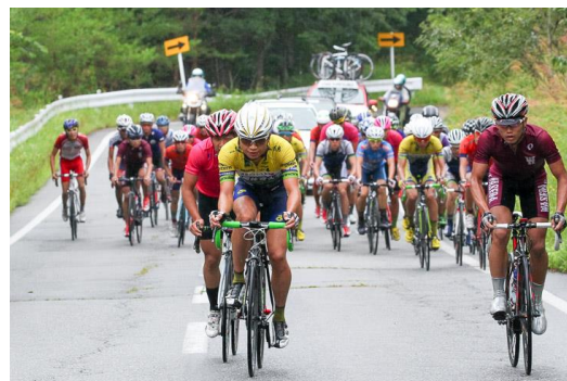
全日本学生自転車競技トラック新人戦