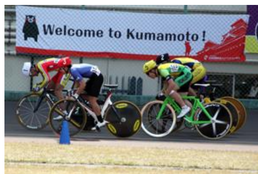
全国高等学校選抜自転車競技大会 (トラック)