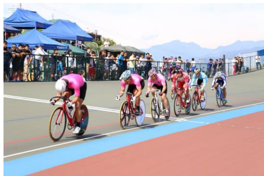
全日本大学対抗選手権