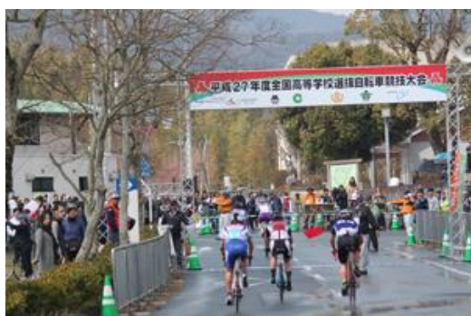
全国高等学校選抜自転車競技大会 (ロード)

①全国高等学校体育連盟自転車競技専門部 (高体連) 事業 http://www.hs-cycling.com/